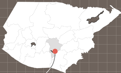
グアテマラ県 フライハーネス