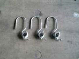
H-5 クランプ付ハンガー