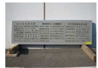
B-1 法定表示板(グレー)