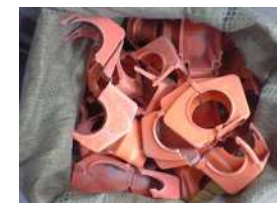
I-11 クランプカバー(赤)