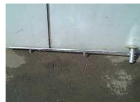
H-7 単管社旗ハンガー