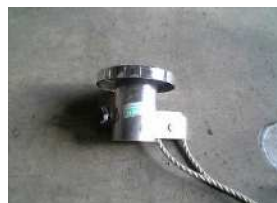
H-6 プーリーキャップ