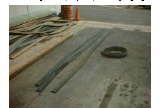
C-3 ケーブルプロテクター