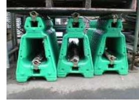
I-2 単管バリケード(プラ)