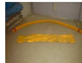
D-14 ジャバラ管, D-15 防護シート