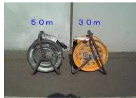
G-2 ドラムコード(整備済)