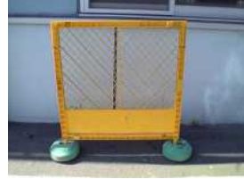
I-1 ガートフェンス(プラ)