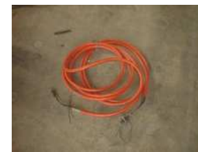
D-1 ピカピカチューブ