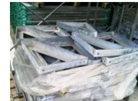
H-11 アングルブラケット