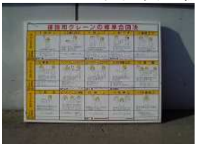
B-12 クレーン合図表示板