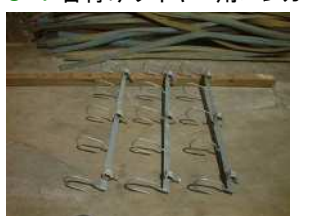
C-1 台付けワイヤー用ハンガー