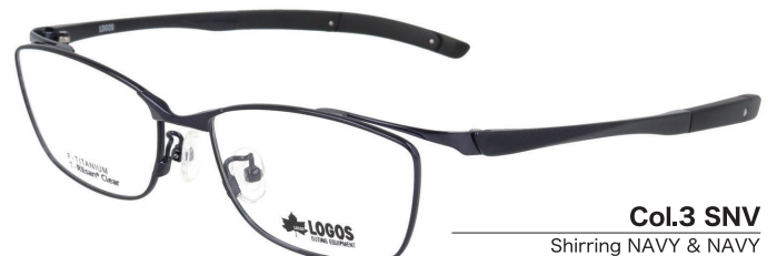
Col.3 SNV Shirring NAVY & NAVY