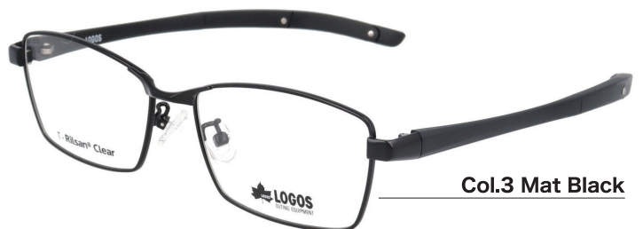
Col.3 Mat Black