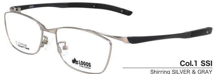
Col.1 SSI Shirring SILVER & GRAY