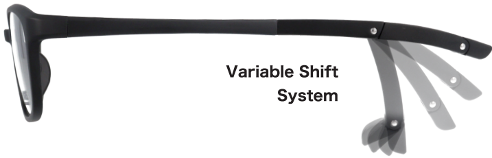
Variable Shift System