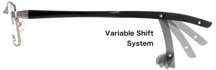
Variable Shift System