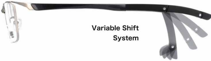
Variable Shift System