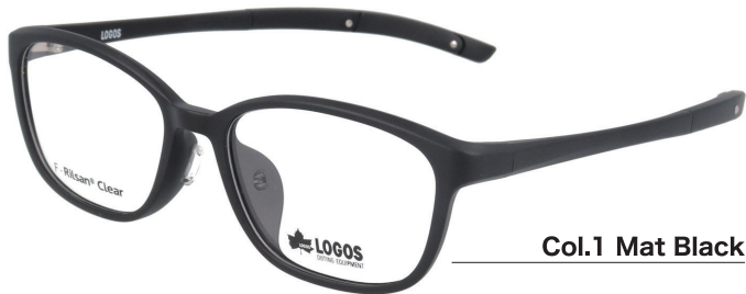
Col.1 Mat Black