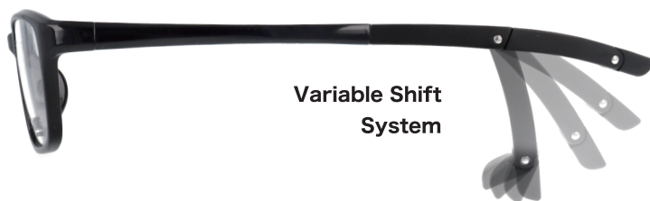
Variable Shift System