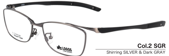
Col.2 SGR Shirring SILVER & Dark GRAY