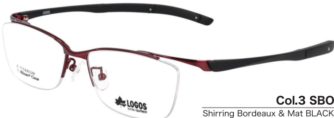
Col.3 SBO Shirring Bordeaux & Mat BLACK