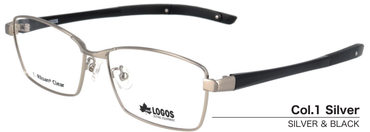
Col.1 Silver SILVER & BLACK