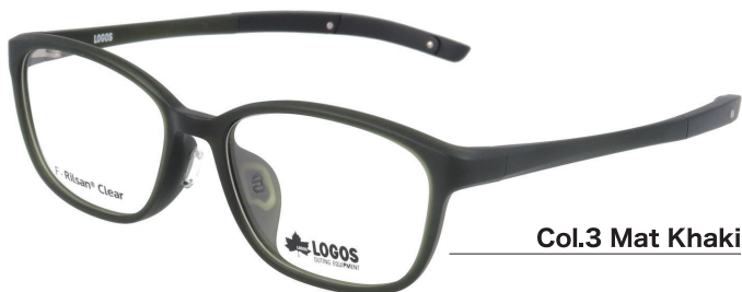
Col.3 Mat Khaki