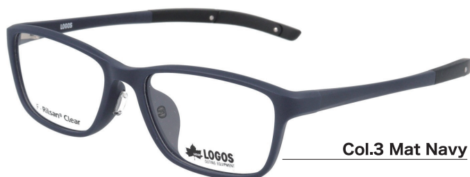
Col.3 Mat Navy