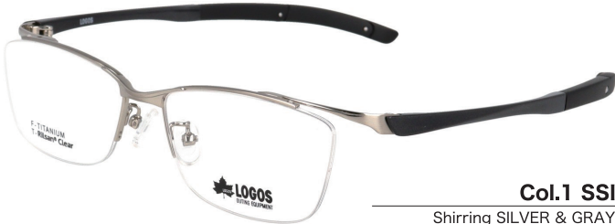
Col.1 SSI Shirring SILVER & GRAY