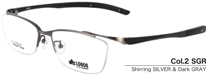
Col.2 SGR Shirring SILVER & Dark GRAY